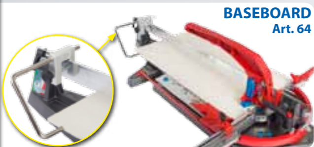
BASEBOARD Art. 64