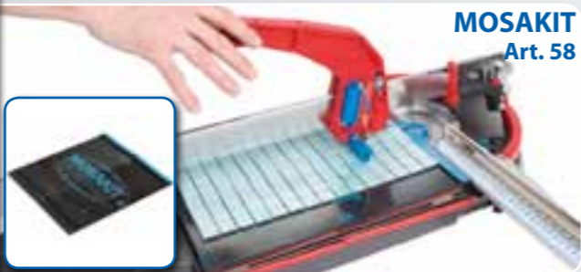
MOSAKIT Art. 58