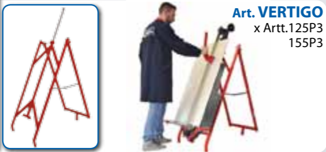
Art. VERTIGO x Artt.125P3 155P3

GARANZIA - Tutte le tagliapiastrelle manuali MONTOLIT sono coperte da garanzia a vita (riconosciuta a giudizio esclusivo dell'Ufficio Tecnico della Brevetti MONTOLIT S.p.A.) su eventuali difetti di costruzione. Guasti derivanti da un uso non conforme o da normale usura sono esclusi dalla presente garanzia.