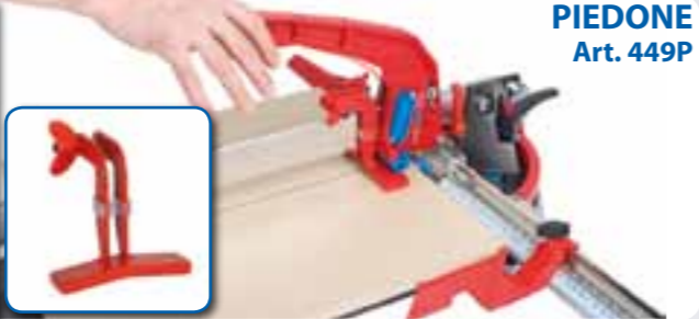
PIEDONE Art. 449P

ACCESSORI • ACCESSORIES • ACCESSORI • ACCESSORIES • ACCESSORI • ACCESSORIES